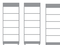
3 x HVS 12.8